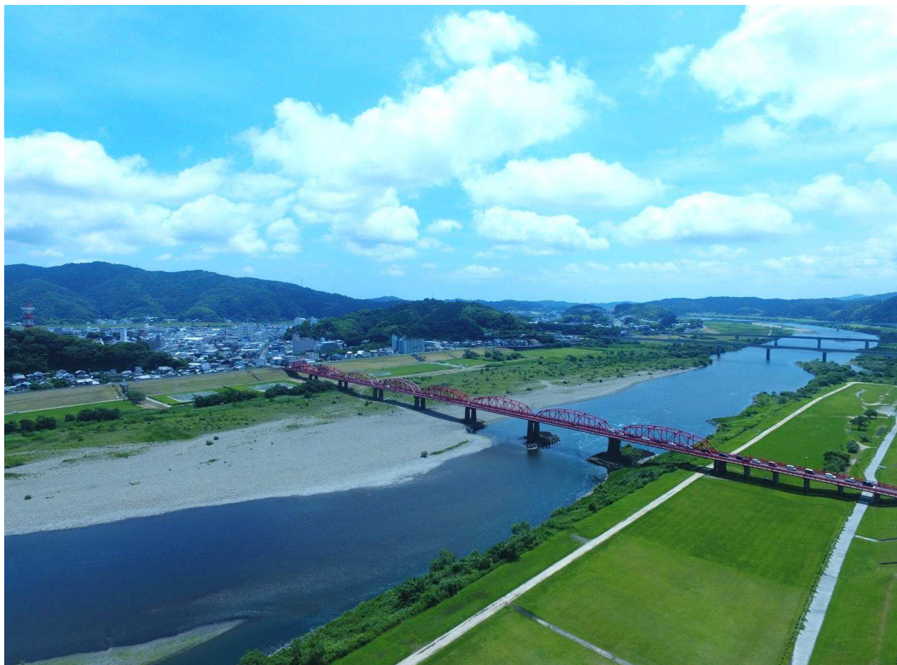
四万十川と赤鉄橋（高知県四万十市渡川）