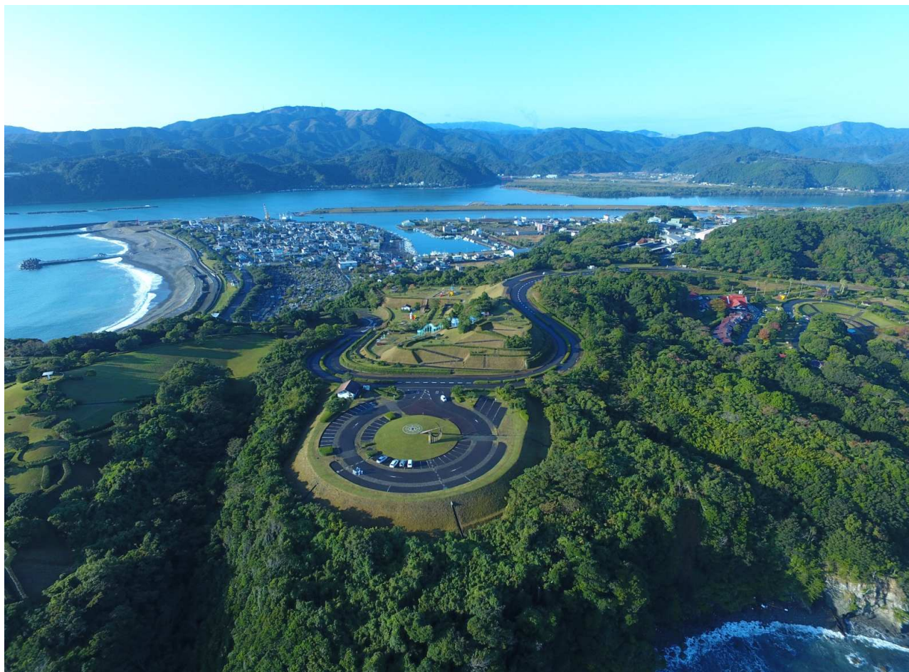
土佐西南大規模公園（高知県四万十市下田）